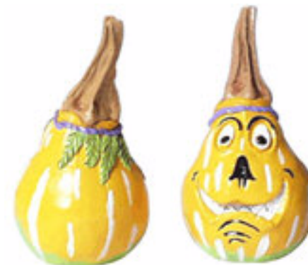
La coloquinte est une plante herbacée vivace de la famille des Cucurbitacées. Elle est cultivée dans les pays tropicaux comme plante médicinale pour la pulpe de ses fruits.