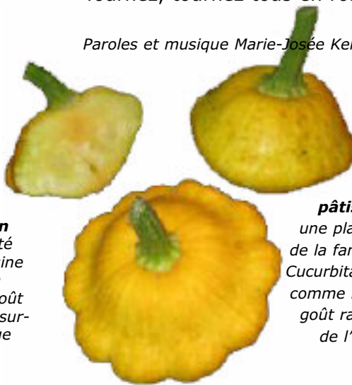
Le pâtisson est une plante annuelle de la famille des Cucurbitacées cultivée comme légume. Son goût rappelle celui de l'artichaut.