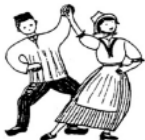
Le rigodon , danse traditionnelle du Sud-Est de la France