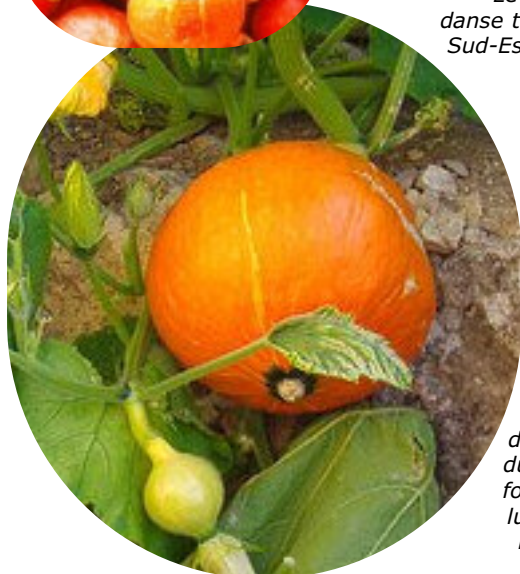
Le potimarron est une variété de courge voisine du portiron. Sa forme et son goût lui ont valu le sur- nom de courge châtaigne.